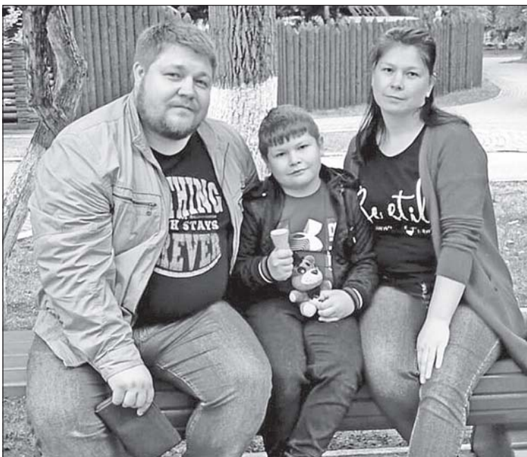
■ Семья Кречмар.

было задание: роботам нужно было захватить флаг у вражеской команды, с соответствующей скоростью поддерживать нужную дистанцию. К сожалению, мы не сумели пробиться к призовым местам, но и на последнем не оказались.