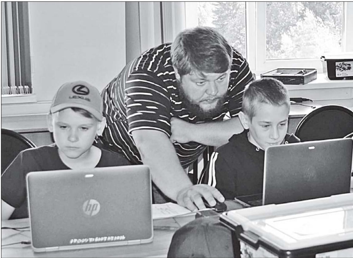
■ На занятиях.

Мы регулярно участвуем в конкурсах и показываем наши работы. Где-то получается успешно, но и бывали случаи, когда попадали в серьезную конкуренцию. Допустим, на кубок губернатора Томской области, который ежегодно проводится в областном центре, приехали участники из Казахстана, Китая, крупных городов России - всего более двухсот участников. У нас