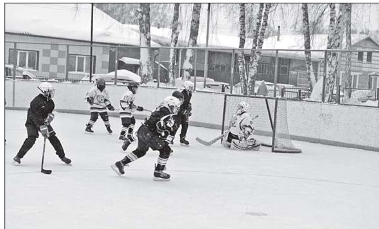
■ Атака наших ребят.