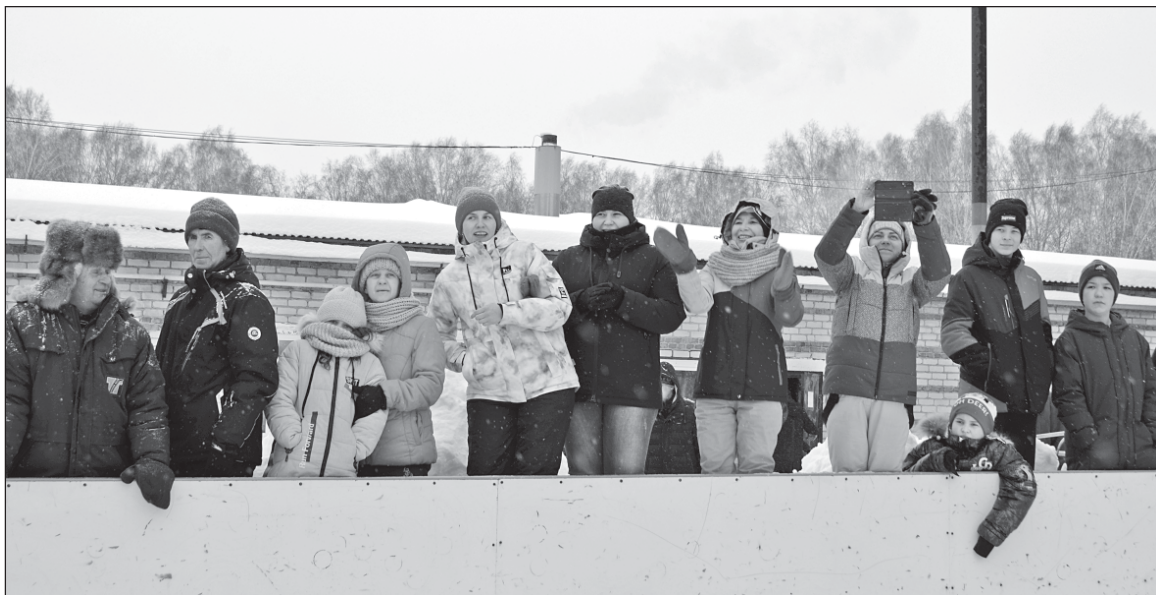
■ Активные болельщики.