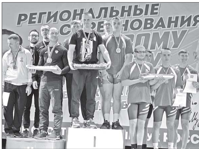
■ Победители гиревой эстафеты.