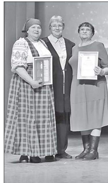
■ Победители номинации «Активный ветеран».

Любовь зрителей - самая большая награда для артиста. Приз зрительских симпатий и денежное вознаграждение в сумме 10 тысяч рублей полу-