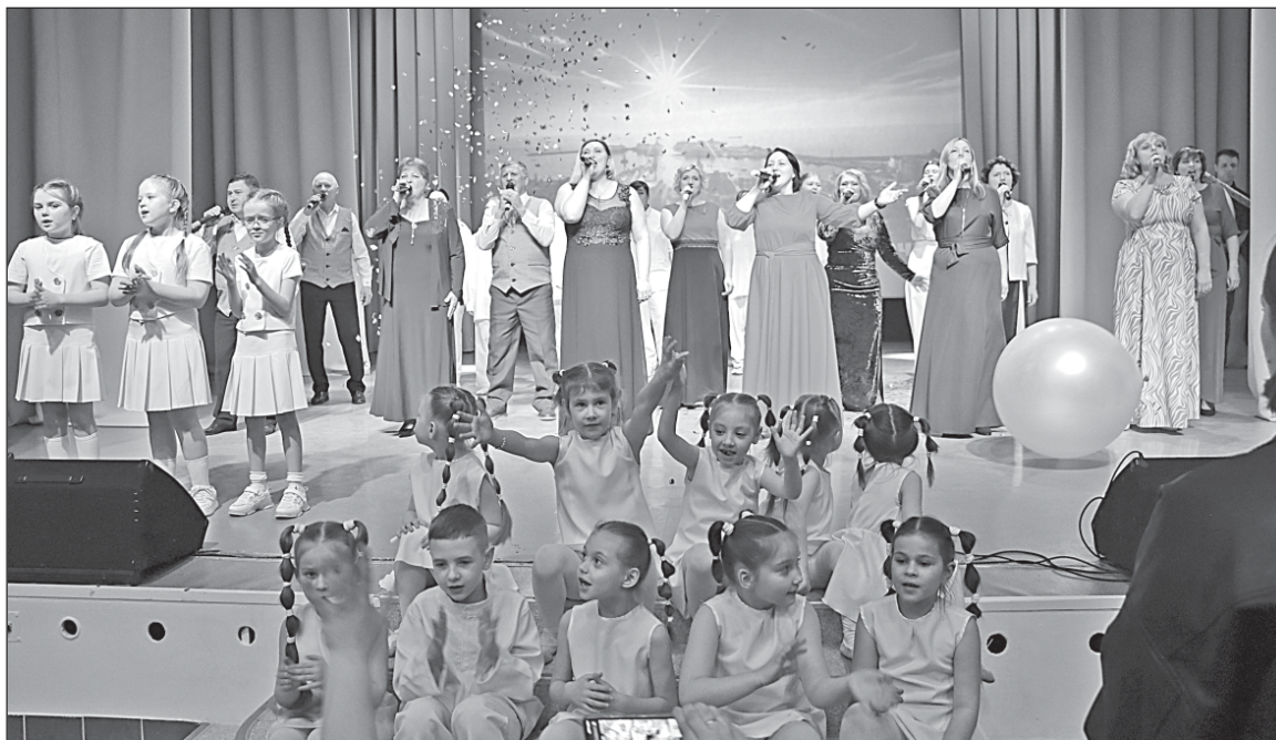
■ Финальный выход артистов Кожевниковского сельского поселения.