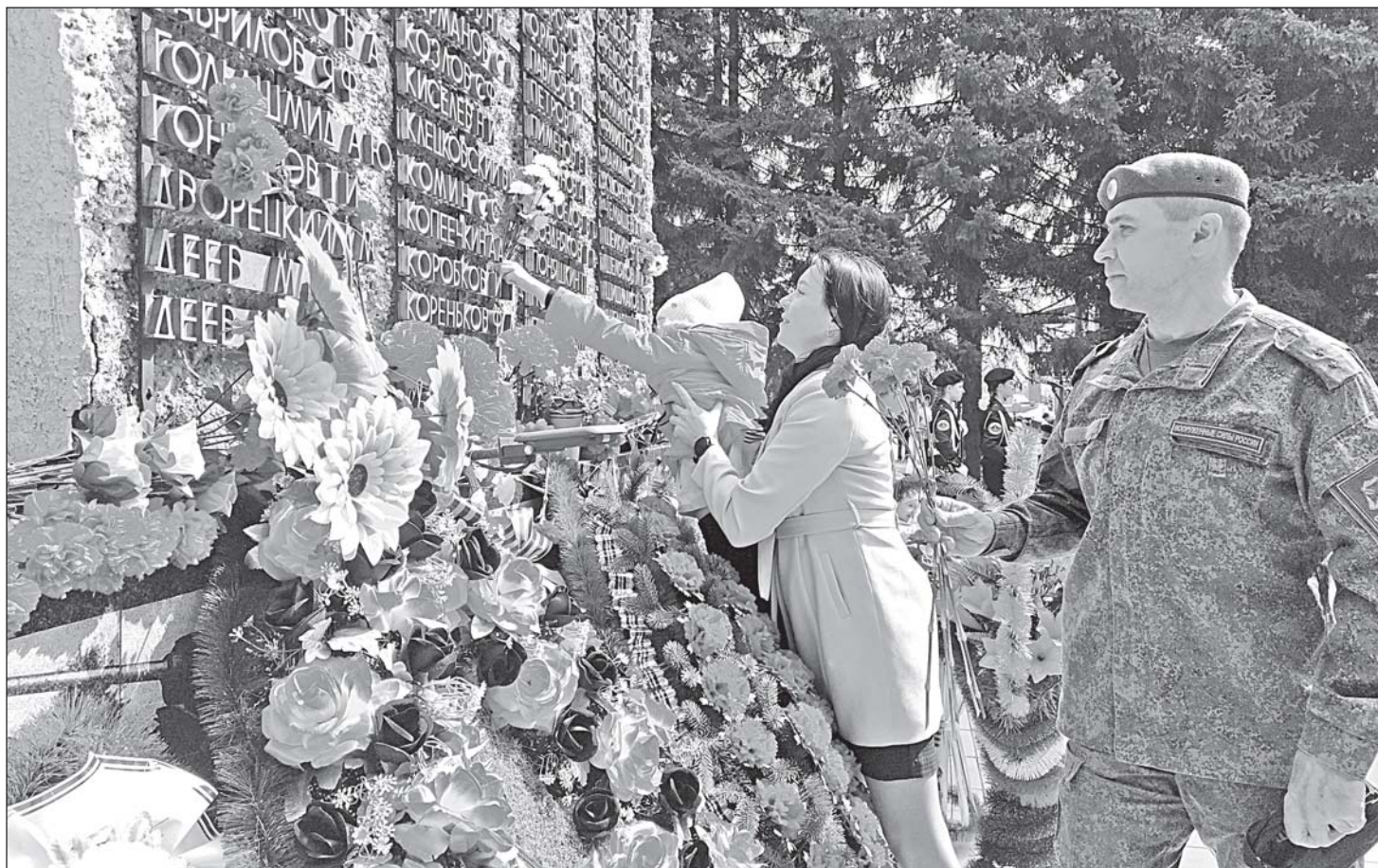
■ Возложение венков и цветов к обелиску Славы, 2023 год.

9 мая в Кожевникове состоится парад легковых автомобилей. Построение автоколонны в 8 час. 45 мин. у центральной библиотеки. В 11.00 часов у обелиска Славы пройдет торжественное мероприятие с возложением цветов. У отделения почты будет организована полевая кухня. Концертные программы пройдут на площадках у магазина «Магнит», здания библиотеки, ДШИ и в сквере напротив торгового центра «Лайдер». На стадионе «Колос» - соревнования по футболу, волейболу, легкой атлетике, городкам и пулевой стрельбе. Начало в 13.00 часов.